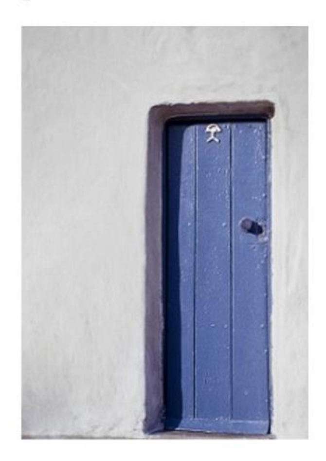
¿Qué es el Índalo?

El Índalo es una figura de un dios prehistórico con un arco iris que ofrece protección frente a posibles inundaciones.